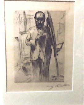
Photo 10: Lovis Corinth Original im Stadtmuseum Gwardevsk, friedlich vereint mit .....

Photos 11 und 12: .....dem Künstler selbst und.....Lenin.