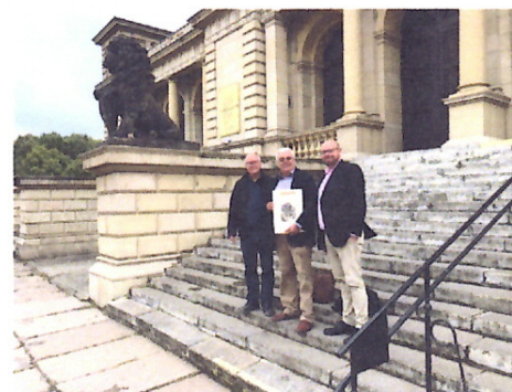
Photo 6: LCG Delegation vor dem Eingang zum neuen KMBK Domizil (in der ehemaligen Königsberger Börse)

Postadresse: Lovis Corinth Gesellschaft e. V. Potosistr. 33 22587 Hamburg